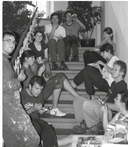
Bild: Pause beim Arbeitseinsatz